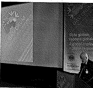
Un momento del GASForum.