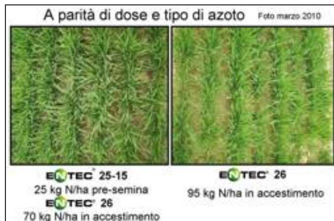
[ Foto 2 - Grazie all'inibitore Dmpp si ottiene migliore accestimento dividendo la dose con una quota già in pre-semina rispetto alla stessa dose tutta all'accestimento.

La terza C riguarda la Corretta epoca perché deve verificarsi sincronia tra disponibilità dei nutrienti e fabbisogno della coltura. L'azoto dei concimi generici è rapidamente trasformato in azoto nitrico, mobile lungo il profilo: di conseguenza è necessario razionare la dose e fare interventi tempestivi altrimenti subiranno perdite e inefficienze (Foto 2).