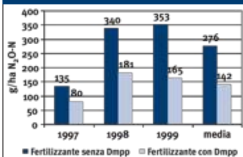
[ GRAF. 1 - L'INIBITORE DMPP

Applicato ai fertilizzanti permette di ridurre drasticamente le emissioni di protossido di azoto N 2 O (potente gas serra) rispetto all'azoto senza inibitore (Weiske e coll., 2000)