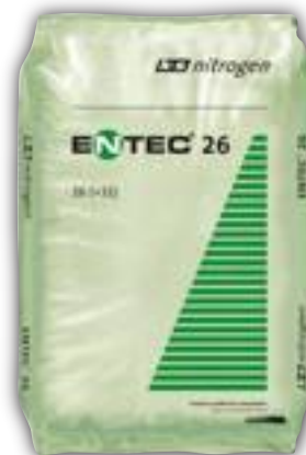
[ Fig. 1 - Entec® 26, con azoto nitrico (7,5%) e ammoniacale (17,5%) e alto contenuto in zolfo (32%) è stato il primo concime con azoto stabilizzato dal Dmpp applicato in Italia, oggi distribuito da K+S Nitrogen.

Una fertilizzazione efficiente è un fattore chiave per l'agricoltura sostenibile: l'agricoltore deve tenere presente le "4 C"