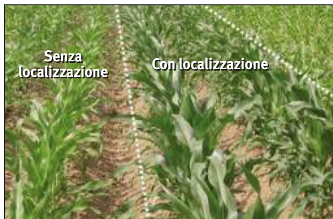
[ Foto 1 - I concimi complessi ben granulati come Entec® 13-10-20 o Entec® 25-15 possono essere localizzati alla semina migliorando lo sviluppo nelle prime fasi.

In localizzazione però si possono utilizzare solo concimi perfettamente granulati, esenti da polvere, della giusta durezza e scorrevolezza,