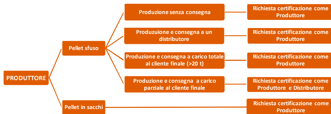
Figura 1: Panoramica delle diverse attività che richiedono la certificazione dei produttori.

Le attività che richiedono la certificazione per un produttore, e di conseguenza il pagamento della tariffa precedentemente illustrata, sono riportate schematicamente in Figura 1.