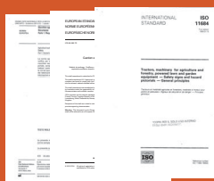
NORME DI RIFERIMENTO NORMATIVES