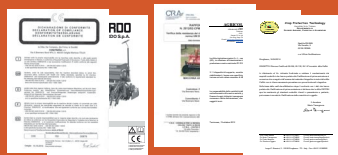
CONTROLLO DOCUMENTAZIONE DOCUMENT VERIFICATION