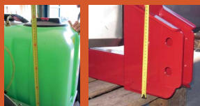
VERIFICHE DI SICUREZZA (ISPETTORI) SAFETY AUDIT (INSPECTORS)