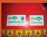
QUALIFICAZIONE DEL PRODOTTO PRODUCT QUALIFICATION