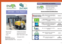
RICONOSCIMENTO INTERNAZIONALE INTERNATIONAL RECOGNITION