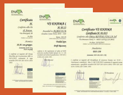
CERTIFICATI VS ENAMA VS ENAMA CERTIFICATES