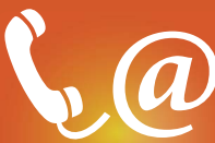
SUPPORTO TECNICO TECHNICAL SUPPORT