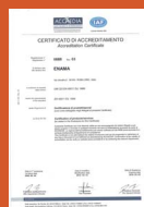
ACCREDITAMENTO ACCREDIA ACCREDIA ACCREDITATION