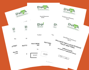
DISCIPLINARI E CHECK LIST DI SICUREZZA SAFETY DISCIPLINARIES AND CHECK LISTS